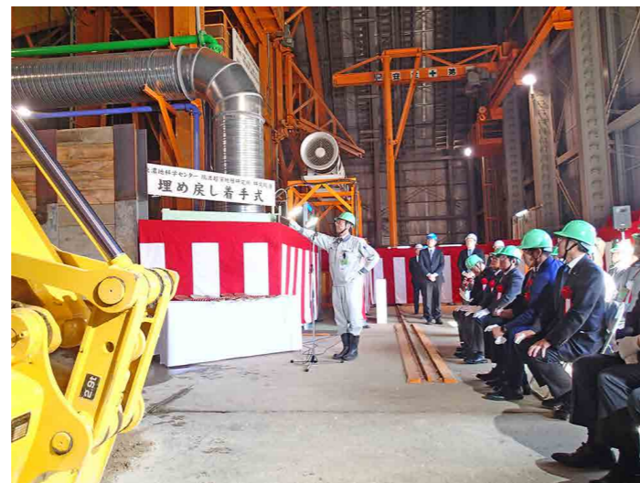
研究坑道内（深度500m）に埋め戻しに使う 砂の搬入開始を合図