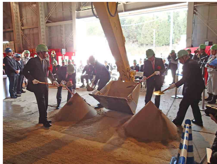
代表者がスコップで埋め戻しに使う砂を ショベルカーのバケットに投入