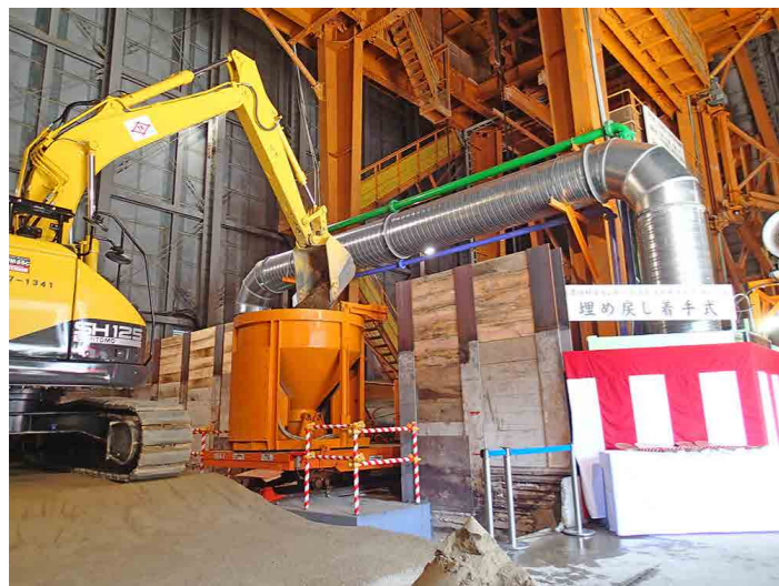
ショベルカーで埋め戻しに使う砂を ギブルに投入