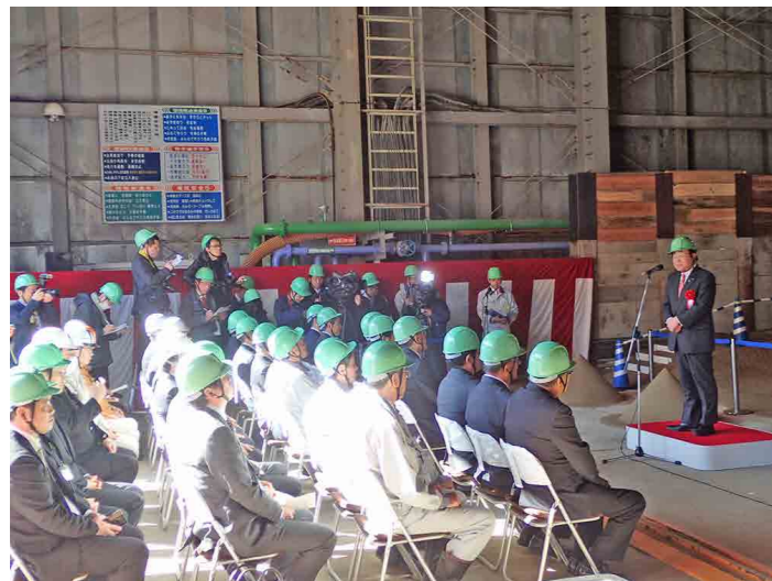
着手式会場の様子

坑道の埋め戻しに際しましては、これまでどおり地元自治体との協定を遵守するとともに、安全確保を第一に作業を進めて参ります。